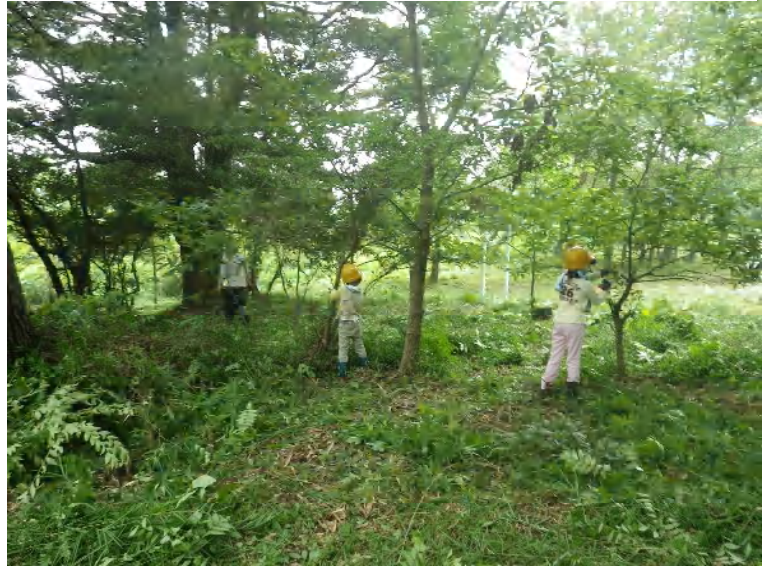
高間キャンプ場での森林整備ボランティア

早いもので弊組合は総社市、矢掛町各森林組合が合併して丁度六ヶ年になります。この間、組合員の皆様や関係各位のご支援をいただきながら「堅実な